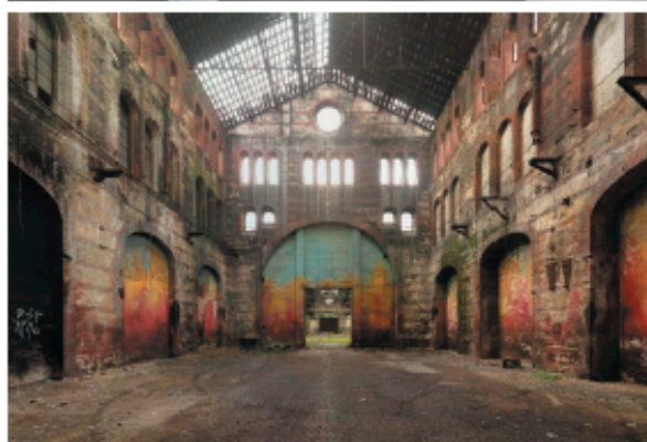
Officine Grandi Riparazioni, esterno ed interno Torino